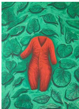
O Fato do Menino ou Portugal , 2002. Óleo sobre tela, 200 cm x 150 cm

Esta Deposição é a conclusão de um longo processo e a última de um conjunto de três pinturas emanadas do mesmo tipo de iconografia. A primeira é O Ninho , numa alusão ao nascimento e ao início, a segunda é As Montanhas numa alusão à fuga para o Egipto, aos percursos e por último, a pintura que aqui se expõe, numa alusão ao fim e ao reinício.