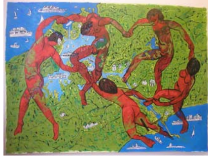
A Dança no Canal do Panamá , 2009. Óleo sobre tela, 150 cm x 204 cm

O canal do Panamá, construído entre 1904 e 1914, estabeleceu a ligação marítima entre o Atlântico e o Pacífico substituindo a anterior ligação pelo estreito de Magalhães. Faz a divisão entre as Américas. É por isto, e naturalmente, um ponto sensível de interesses estratégicos.