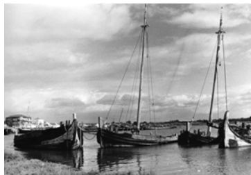
Cemitério , 1985. Rosário, Moita

(uma fragata do Tejo), a fundação de uma cooperativa de dinamização cultural denominada A Barca , o aprofundamento dos estudos em ciências da arte através da obtenção do mestrado na Universidade Nova de Lisboa com a tese «Arquitectura Retabular no século XVI» e as actividades de docente e de artista plástico exercidas em paralelo e em permanência.